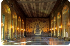
斯德哥爾摩市政廳---諾貝爾晚宴會場 [斯德哥爾摩市政廳---諾貝爾晚宴會場]