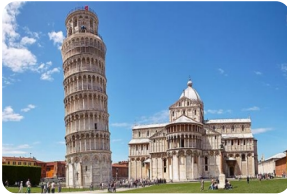
比薩斜塔及其周邊