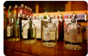
巴黎花宮娜香水博物館