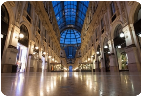
埃馬努埃萊二世拱廊橋 [埃馬努埃萊二世拱廊橋]