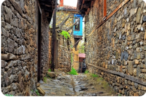
硃馬勒克茲克小鎮