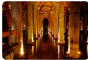
耶萊巴坦地下水宮