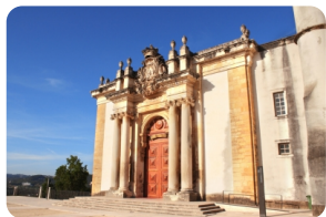
科英布拉大學巴洛克式圖書館 [科英布拉大學巴洛克式圖書館]