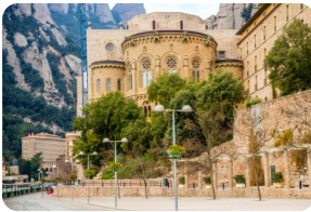
蒙特塞拉特修道院