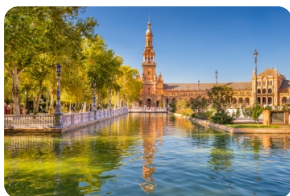
塞維利亞西班牙廣場