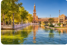
塞維利亞西班牙廣場