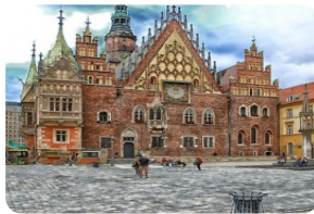
弗羅茨瓦夫市政所