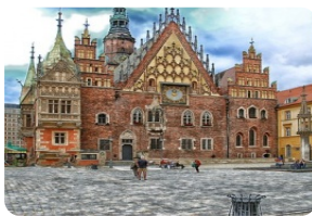
弗羅茨瓦夫市政所