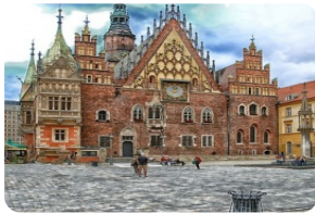
弗羅茨瓦夫市政所