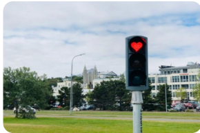
阿克雷裡網紅愛心紅綠燈