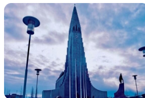
哈爾格林姆斯教堂