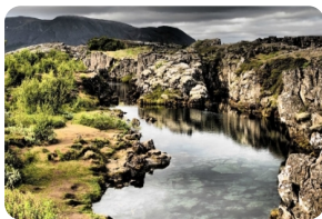
辛格維利爾國家公園