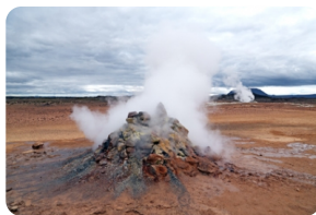
圓錐形火山噴火口