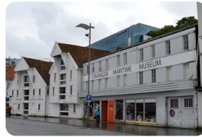
斯塔萬格海事博物館