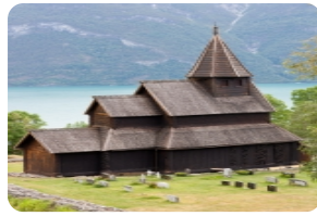
烏爾內斯木板教堂