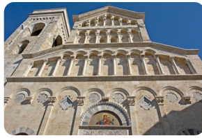
自由行卡利亞裡聖瑪利亞教堂