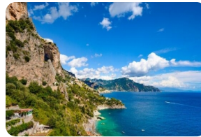
阿馬爾菲北部海岸線