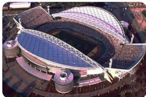
巴塞羅那奧林匹克體育場