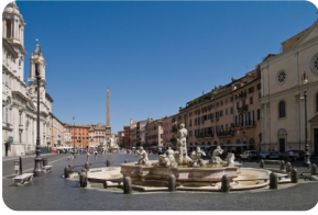
自由行納沃納廣場