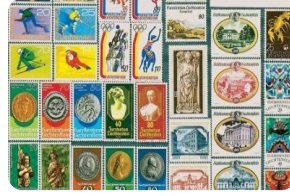
列支敦士登郵票博物館