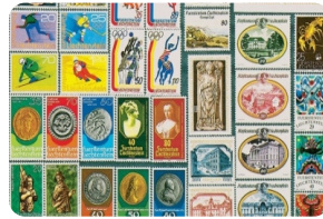
列支敦士登郵票博物館