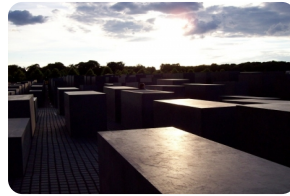
猶太人大屠殺紀念碑群