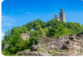
大特爾諾沃古城堡