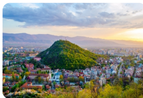
普羅夫迪夫老城區