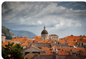
杜佈羅夫尼克鐘樓