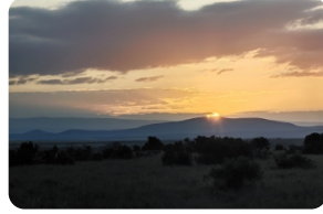
奧珮傑塔野生動物保護區