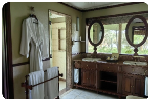
埃爾矇塔塔 Serena [埃爾矇塔塔 Serena]