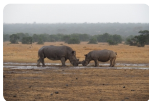
奧·珮傑塔自然保護區