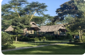
奧珮傑塔野生動物保護區