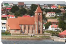
福克蘭群島斯坦利港