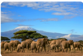
安博塞利國家公園