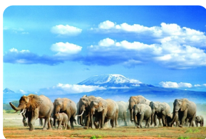
安波塞利國家公園