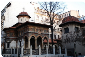
史達弗洛波裡奧斯教堂

羅馬尼亞雅典娜神廟： 是佈加勒斯特市中心的一座音樂所，也是佈加勒斯特的地標建築之一，於1865年由羅馬尼亞雅典文化協會修建這座建築，是由法國建師Albert Galleron設計。如果遇到有舉辦音樂會的話，不妨買票進去欣賞一下美妙的音樂並品味這座新古典主義的建築。