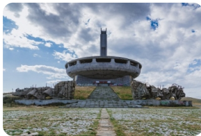
佈茲盧德紮紀念碑