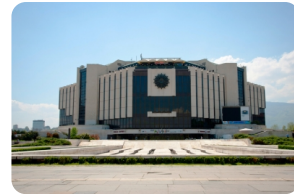
索非亞國家文化宮