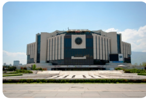
索菲亞國家文化宮