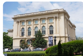
羅馬尼亞國家藝術博物館