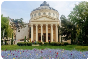
羅馬尼亞雅典娜神廟