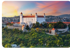
布拉迪斯拉發城堡