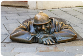
街尾巷間的絕妙雕像