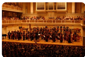
Johann Sebastian Bach音樂學院