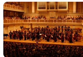
Johann Sebastian Bach 音樂學院