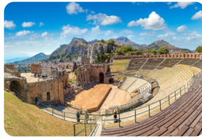
希臘露天圓形劇場