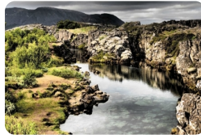
辛格維利爾國家公園