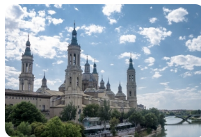
比拉爾聖母大教堂