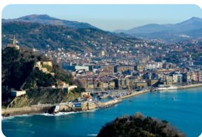
聖塞瓦斯蒂安老城