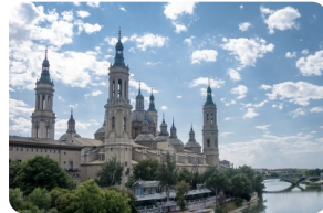
比拉爾聖母大教堂