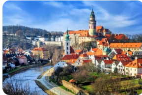
CK小鎮--中世紀童話小鎮