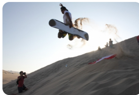
悉尼 - 滑沙