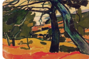
自由行康提尼博物館