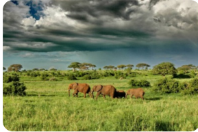
塔蘭吉雷國家公園