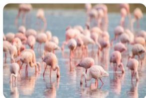
恩戈羅自然保護區