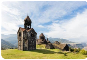
哈巴特及薩納訥脩道院