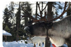
短途馴鹿雪橇及農場參觀