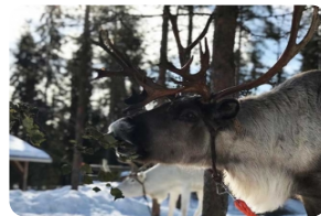
短途馴鹿雪橇及農場漫觀