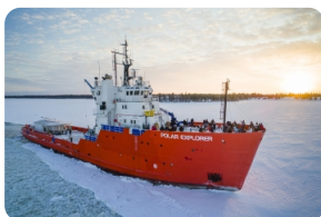
極地探險號破冰船

說明： 導遊可現場協助預訂酒店提供的玻璃屋與皮海酒店之間的來往交通，成人5歐/人/單程，兒童2.5歐/人/單程。費用現付給酒店即可。