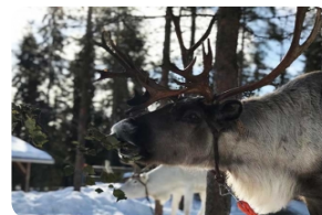
短途馴鹿雪橇及農場漫觀