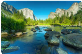
優勝美地國家公園 [優勝美地國家公園]