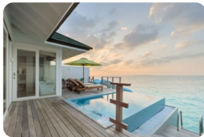
Ocean Villa With Pool + Slide