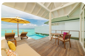
Lagoon Villa With Pool + Slide