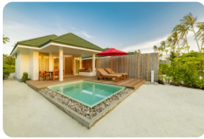
Sunset Pool Beach Villa