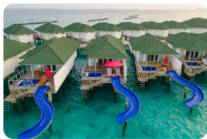
Water Villa With Pool + Slide