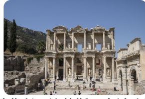
以弗所（埃菲斯）古城遺址