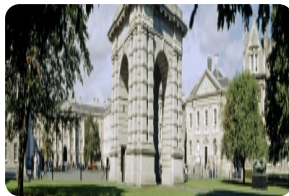
聖三一學院圖書館