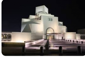
伊斯蘭藝術博物館