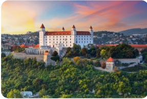
布拉迪斯拉發城堡