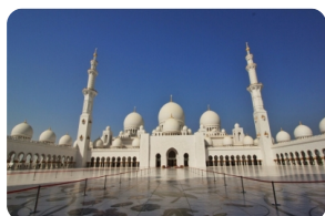
謝赫紮伊德清真寺