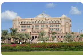
阿佈紮比皇宮酒店

譽為全世界造價最貴的-酋長皇宮酒店，車子緩駛進媲美歐洲皇室的禦花園，穿過如巴黎凱旋門般的大門，如夢一般，落入眼簾，舉目所及皆是金碧輝煌，來自世界各地的各種顏色大理石，施瓦洛世奇水晶吊燈及全世界最大純金打造圓頂...，奢華設計當中又具科技感，此酒店是為國王所設計的，儼然是如國王般的待遇與享受。