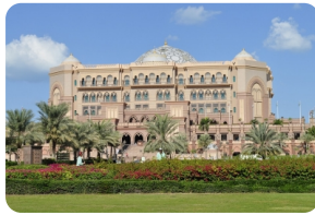
阿佈紮比皇宮酒店