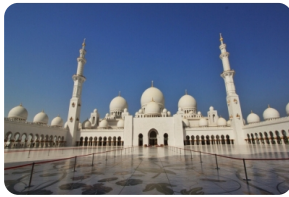
謝赫紮伊德清真寺