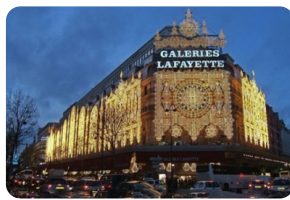
老佛爺百貨公司（奧斯曼旗艦店）