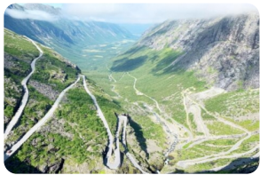
特羅斯蒂山路（精靈之路）