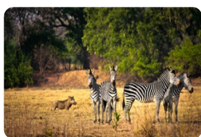
馬賽馬拉國家保護區