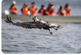
納瓦沙湖(乘船遊湖)