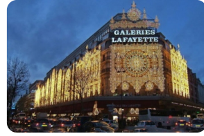
老佛爺百貨公司 (奧斯曼旗艦店)