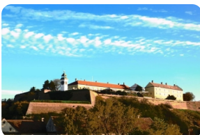
彼德羅瓦拉丁堡壘