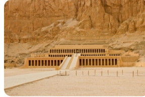
哈特謝普噉特女王神廟