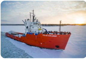
極地探險號破冰船